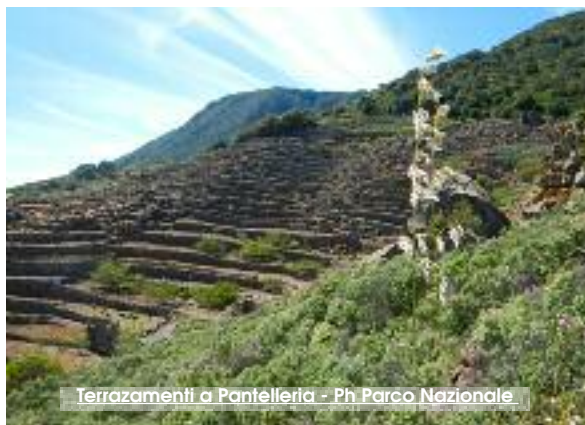
Terrazzamenti a Pantelleria

L'obiettivo comune è quello di condividere gli strumenti di gestione del parco e complessivamente del territorio dell'isola di Pantelleria. Quindi protezione naturalistica coniugata alla presenza degli abitanti e ad una condizione di antropizzazione del territorio che è fatta principalmente di due aspetti economici: l'agricoltura (che con i suoi terrazzamenti ha caratterizzato nei secoli e caratterizza ancor oggi il paesaggio) e il turismo. Nei giorni scorsi incontri si sono svolti presso il Circolo agricolo