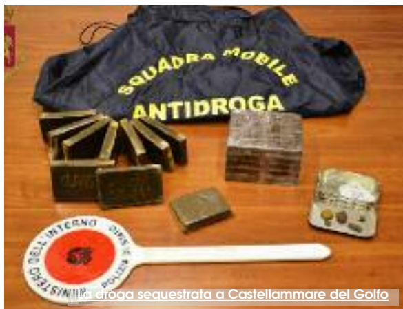
La droga sequestrata a Castellammare del Golfo

Un colpo di fortuna ad un normale posto di controllo, o forse, più verosimilmente un servizio mirato per interrompere un canale di approvvigionamento del traffico e dello spaccio di